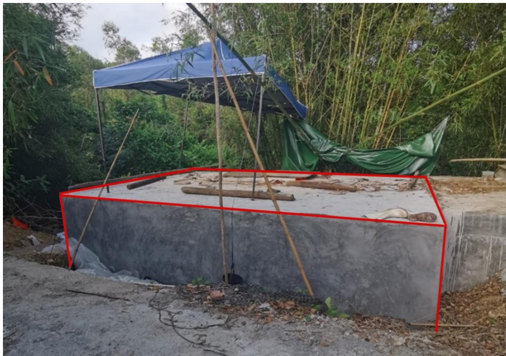
图 1：在建处理池外形（红线部分）

池内壁有未拆除木模板，池底有部分已拆除模板和木方，底部没有浇筑混凝土，铺有一层 2 厘米厚度的疏松潮湿砂浆。