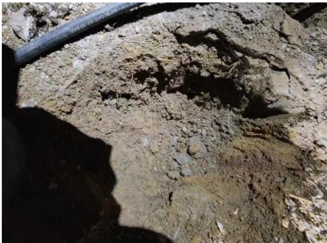
图 3: 池底地表泥土

为查明有害有毒气体来源,事故调查组委托阳东区消防救援大队对处理池进行再次勘查,消防人员刨挖开池底地表泥土时,发现池底地表泥土潮湿并闻到一股刺激性气味(详见图 3)。